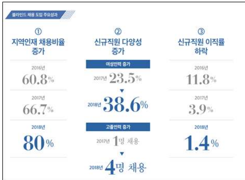
[표1] 한국방송통신전파진흥원의 블라인드 채용 성과

앞서 국내에서 시행된지 이제 갓 2년을 넘긴 공기업 블라인드 채용의 효과 말고도 글로벌 컨설팅 기업 액센추어에서 세계 1,000여 개 기업을 분석해보니 성과가 높은 상위 12%는 조직 내 여성과 비주류 학교 출신, 외국인 채용을 활발히 했다고 합니다.